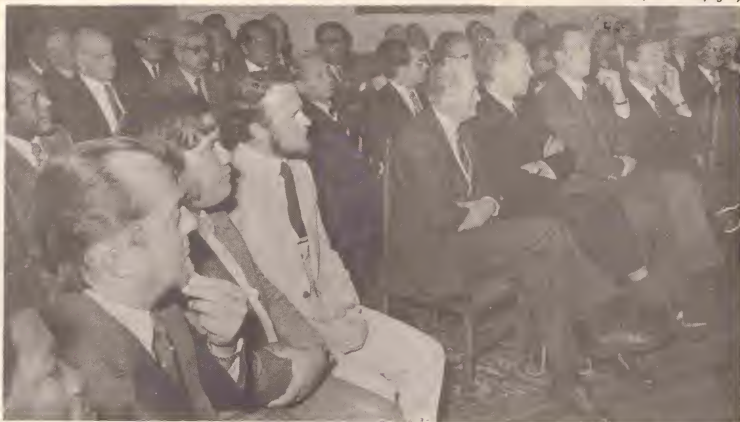
Instalacion di grupo di trabow di Reino na Hulanda ariba 17 di Januari 1979, resultado di e laborman di Gobierno Insular pa cumpli cu e deseo di e pueblo Arubano.